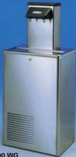
Niagara 400 WG