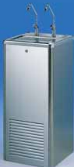
Niagara 100/150 ECO