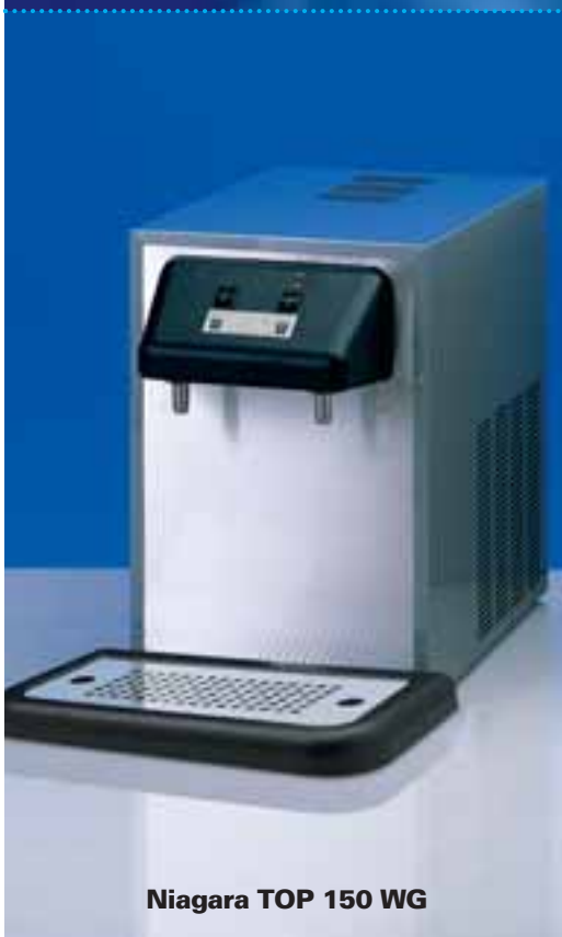
Niagara TOP 150 WG