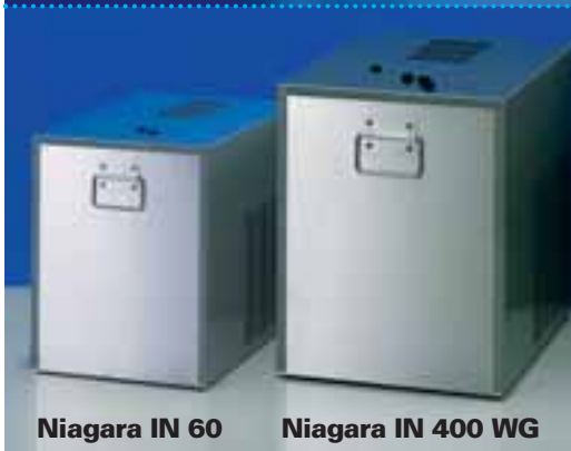
Niagara IN 60