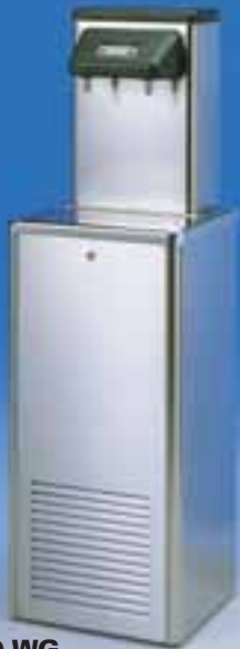
Niagara 150 WG